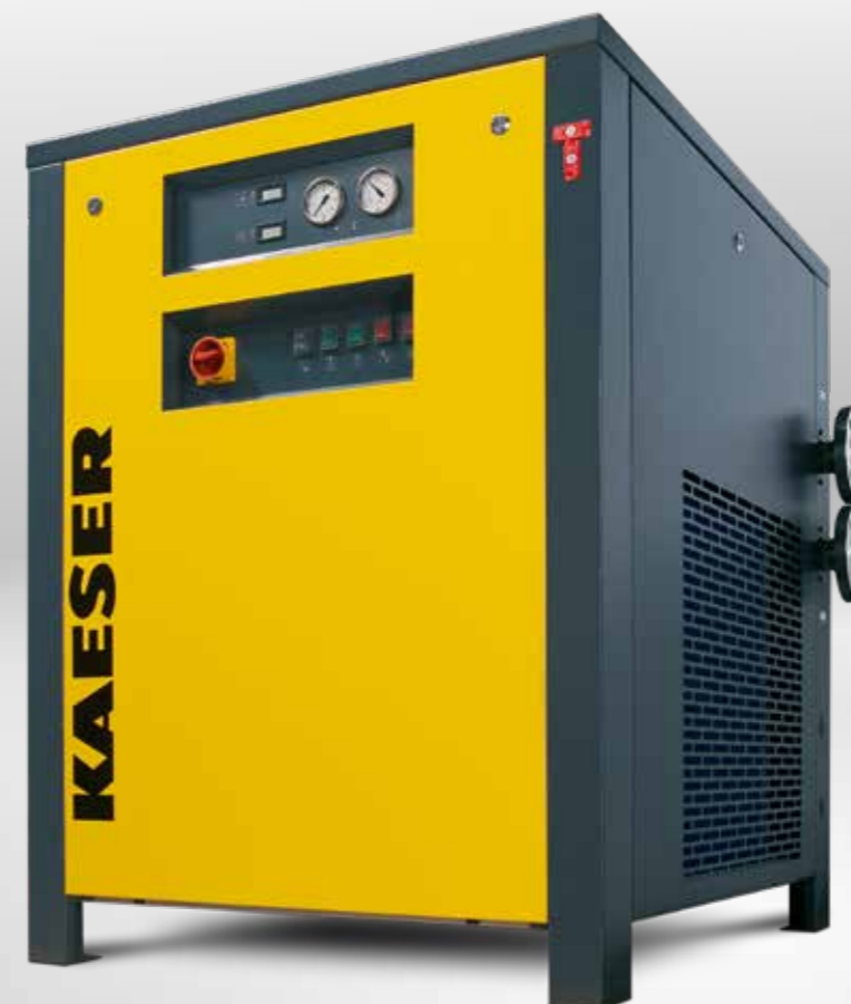
Basisuitvoering THP 40 - 50

De kwaliteit van een koeldroger kan men het best afleiden aan zijn capaciteit om het condensaat, ook bij hoge omgevingstemperaturen, betrouwbaar en bedrijfszeker af te scheiden. Zoals de drogers uit de serie THP, die KAESER KOMPRESSOREN daarvoor de beste eigenschappen heeft meegegeven: Dat begint bij de goede plaatsing van het koelcircuit en gaat verder met de corrosiebestendige, koper gesoldeerde platenwarmtewisselaar uit roestvrij staal. De aparte condensaatafscheider scheidt het condensaat veilig af. De stromingstechnisch geoptimaliseerde leidingen zorgen voor een lager drukverschil. Alle genoemde kenmerken dragen bij tot een hoge betrouwbaarheid van deze koeldrogers conform EN 60204-1. Ze bereiken drukdauwpunten tot +3 °C en vervullen hun taak dankzij ruim bemeten componenten altijd keurig uit – ook bij hoge omgevingstemperaturen tot 43 °C.