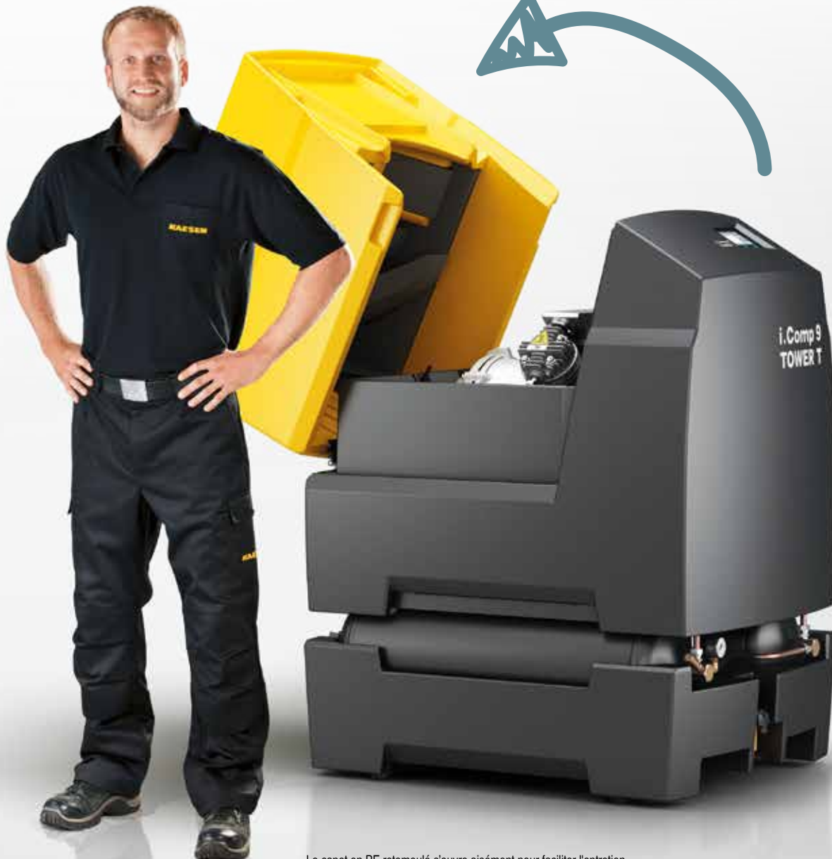
Le capot en PE rotomoulé s'ouvre aisément pour faciliter l'entretien.

Branchez et démarrez – la station d'air comprimé compacte et entièrement équipée nécessite simplement une alimentation électrique et un raccordement au réseau d'air comprimé. Elle ne demande pas d'autres travaux d'installation. L'efficacité énergétique, la facilité d'entretien, la longévité et l'harmonisation optimale de tous les composants garantissent de nombreuses années d'utilisation fiable et économique.