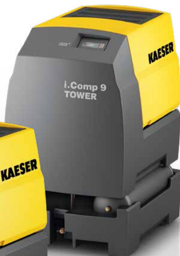
Fig. : i.Comp 9 TOWER