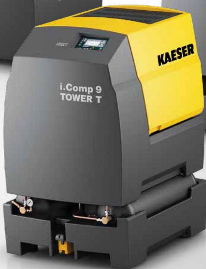
Fig. : i.Comp 9 TOWER T