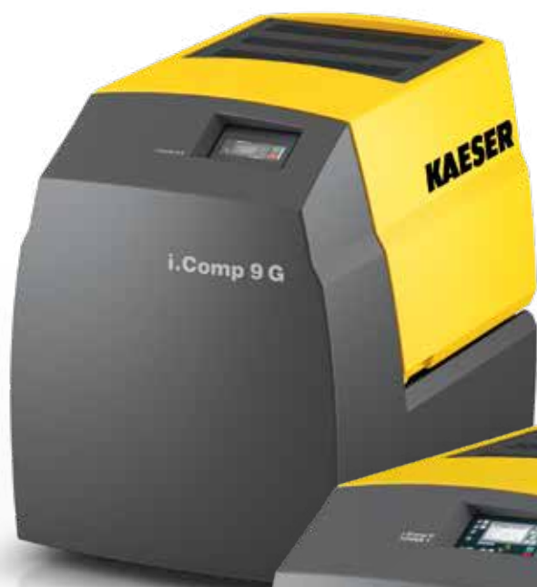
Fig. : i.Comp 9 G