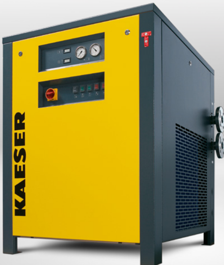
THP 40-50 Version standard