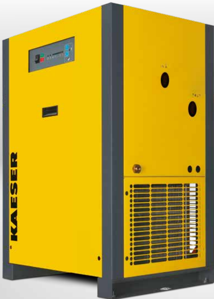
THP 40-50 Version standard