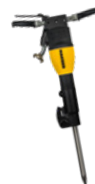
Fig. : AH 180 V