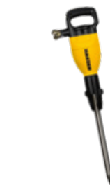
Fig. : H 95