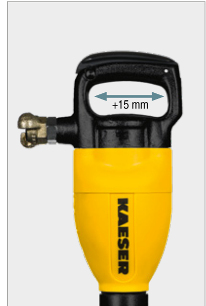
Passage de main agrandi