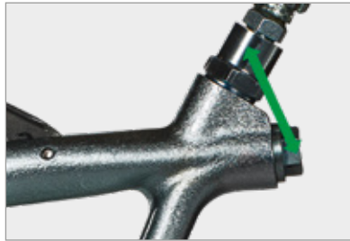
Double raccord sur la poignée