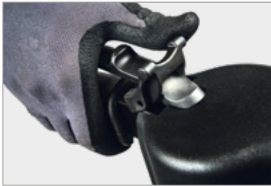
Protection ergonomique du bouton