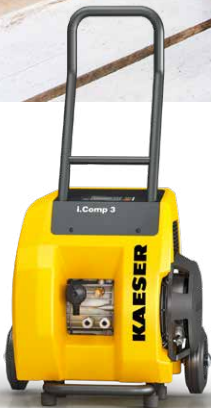
Afb.: i.Comp 3

Uitstekend geschikt om lange afstanden te overbruggen