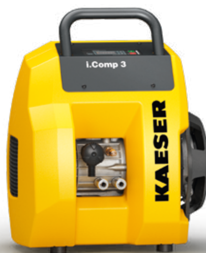
Afb.: i.Comp 3