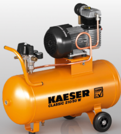
Fig. : CLASSIC 210/50 W