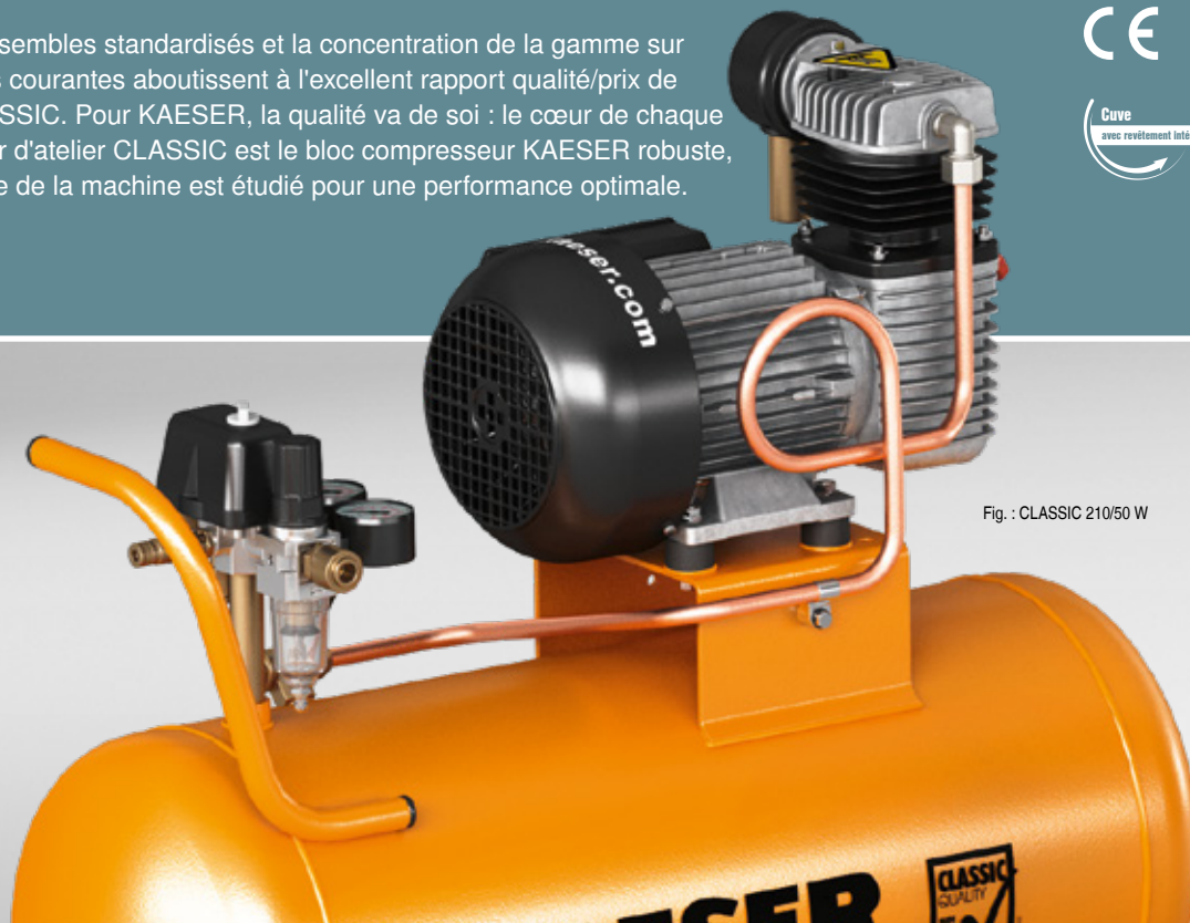
Fig. : CLASSIC 210/50 W