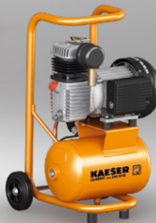
Fig. : CLASSIC mini 210/10 W