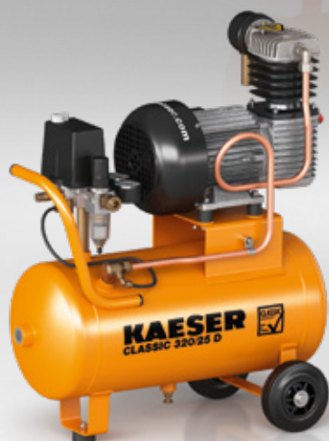
Fig. : CLASSIC 320/25 D