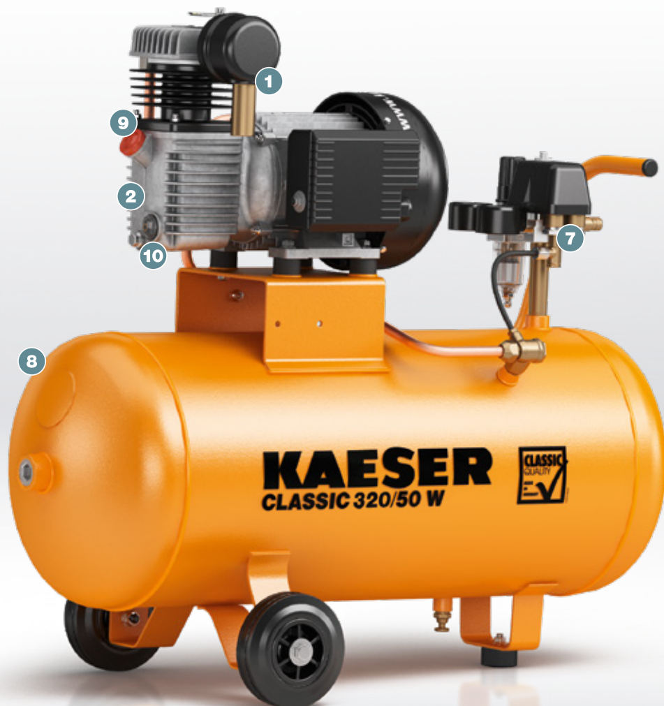
Fig. : CLASSIC 320/50 W