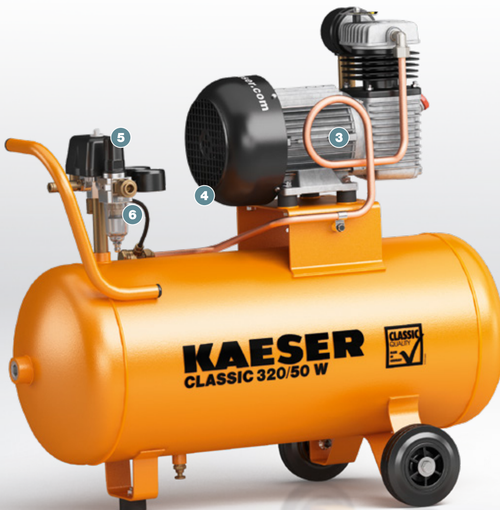
Fig. : CLASSIC 320/50 W